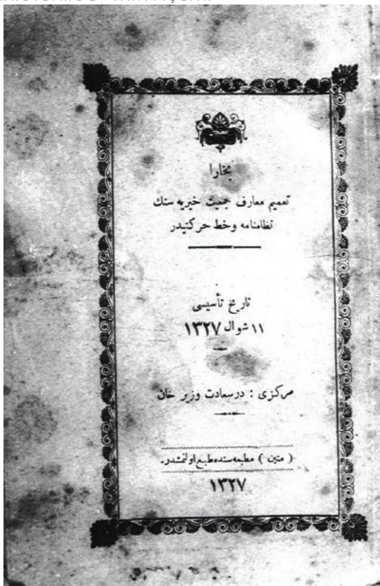
Бухоро таъмими маориф жамияти хайриясининг хатти-ҳаракатлари Истанбул 11 шаввол 1327 (16 октабр 1909) [Темур Хўжа архиви]

“Низомнома”нинг “Бухоро таъмими маориф жамияти хайрияси” хатти-ҳаракатлари боби жамиятнинг мақсадларини ифодаловчи 14 моддадан ташкил топган: