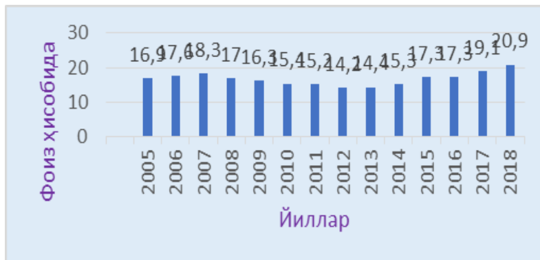
2-расм. 1-6 ёшгача мактабгача тарбия муассасаси камрови[8]

Давлатнинг касб-хунар таълими тизими билан иш берувчи ўртасидаги ҳамкорлик фикримизча, қачонки ҳар икки томон манфаати қондирилганда янада ривожланади. Ишга киришдан олдин юқори сифатли умумий таълим инсоннинг бутун иш фаолияти давомида янги кўникмаларга эга бўлишининг энг яхши кафолати бўлиб, шунингдек, иш берувчининг бундай ходимни касбий тайёргарлигига сармоя киритишдан манфаатдор бўлишидир. Шунинг учун сўнгги йилларда мамлакатимизда мактабгача тарбиядан бошлаб, бошланғич ва ўрта мактаб фаолиятига катта эътибор қаратилмоқда. Ҳукуматимиз Республика аҳолисининг мисли кўрилмаган ўсишига қарамай, мактабгача тарбия муассасасига ёзилиш даражасини кескин оширишга муваффақ бўлмоқда.