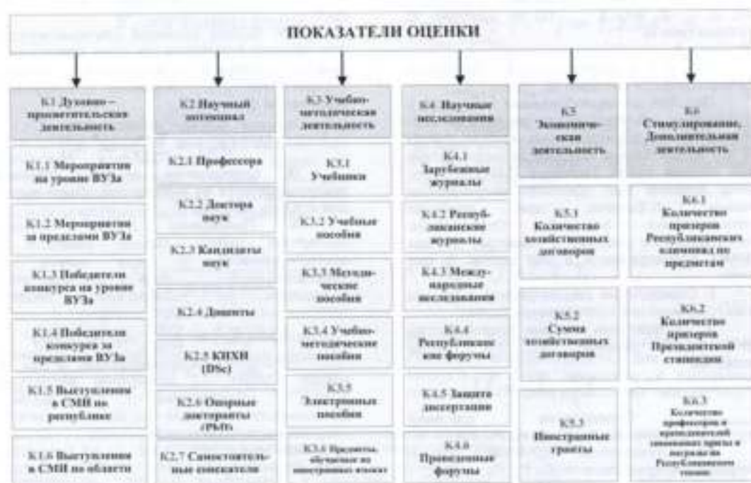
Рис. 1. Показатели оценки эффективности учебного заведения 4

По этим приведенным показателям можно оценить деятельность учебного заведения. Конечно, и вышеприведенные показатели исходя из сути деятельности можно разделить на субпоказатели. А это, в свою очередь, позволит более глубоко изучить деятельность учебного заведения и достичь точности результатов (рис. 1).