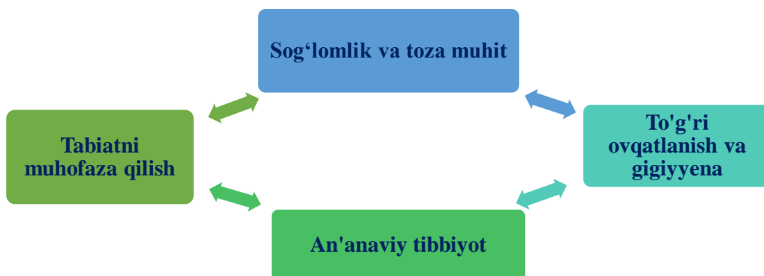
1-rasm. A.Avloniy asarlarida ekologik va tibbiy madaniyatga erishishda ahamiyatli jihatlar

Abdulla Avloniyning asarlarida ekologik va tibbiy madaniyat masalalari turli jihatdan yoritilgan bo'lib, u o'z davri uchun ilg'or fikrlarni ilgari surgan va inson salomatligini saqlash, tabiatni muhofaza qilish va sog'lom turmush tarziga e'tibor qaratgan. Uning asosiy fikrlar quyidagilardan iborat:(1-rasmga qarang).