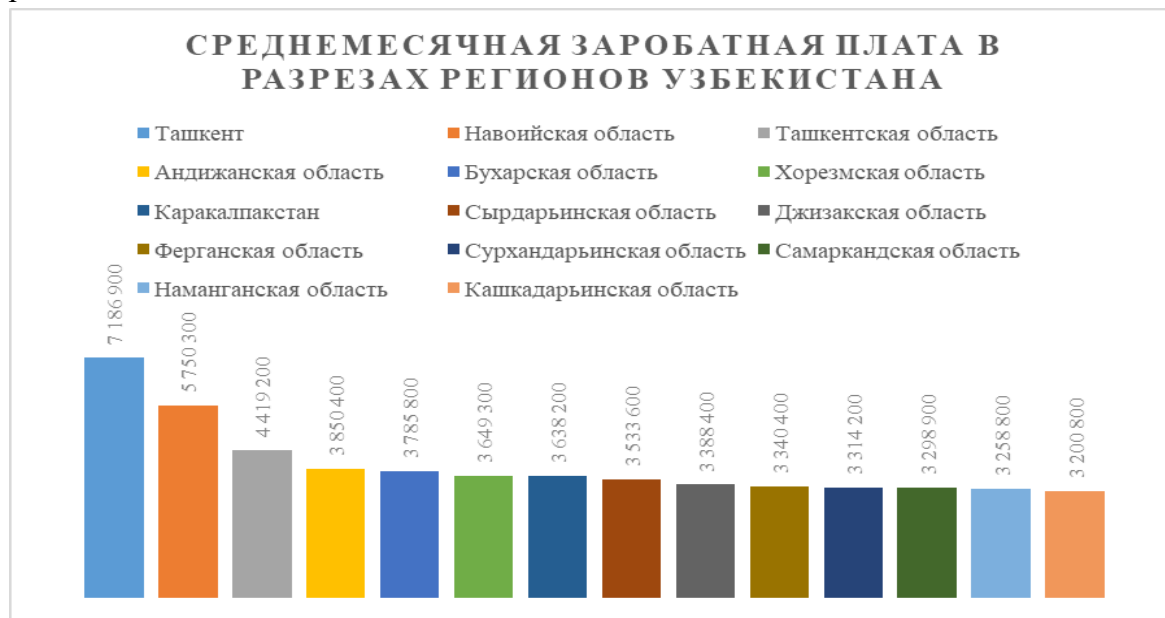
Рисунок 2 Среднемесячная заработная плата в разрезах регионов Узбекистана 6

развитие инфраструктуры в сельского хозяйство регионах, чтобы сделать их более привлекательными для бизнеса. Развитие кластеров: создание производственных цепочек в регионах, повышающих их конкурентоспособность. В Узбекистане реализуется ряд государственных программ, направленных на развитие сельской местности и бизнеса в регионах.