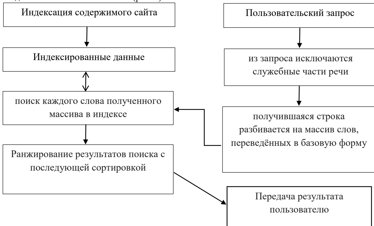
Рисунок 1. Принцип работы создаваемой поисковой машины

Для реализации вышеуказанных определений нам надо сформировать принцип работы создаваемой поисковой машины (рис 1.).