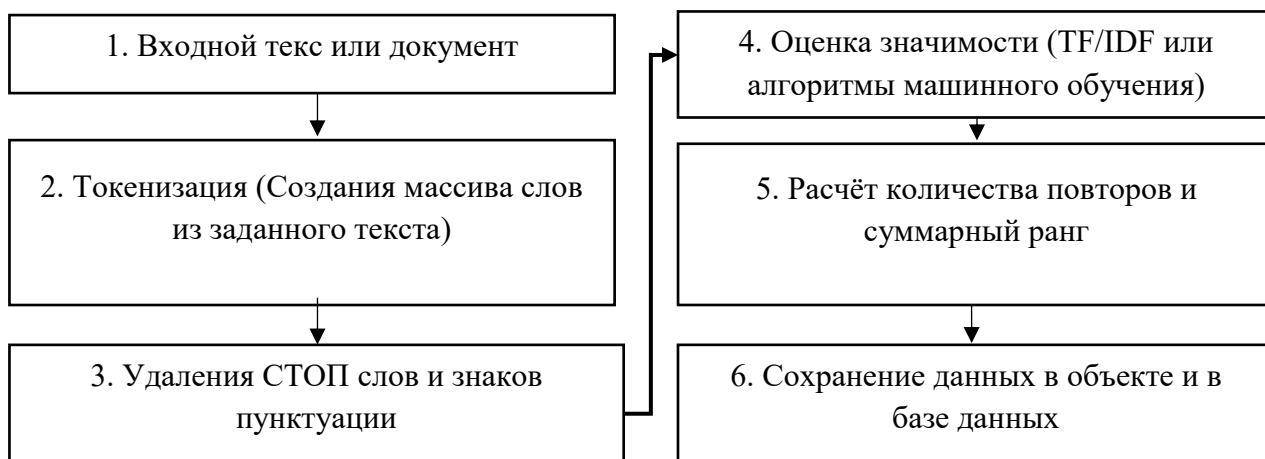
Рисунок 2. Описание работы механизма индексации

Формальное описание индексирования. Для индексации содержимого сайта создаётся специальная база данных, в которую заносится информация, собираемая поисковыми алгоритмами со страниц сайтов, а процесс добавления собранной информации в базу называется индексацией. Далее собранные данные определённым образом обрабатываются, и создается индекс–выжимка из документов. При этом поисковыми запросами учитываются текстовое наполнение, внутренние и внешние ссылки, графические и некоторые другие объекты. Когда пользователь сформирует свой запрос поисковой системе, происходит обращение к этой базе данных. В результате поисковому движку для выполнения поискового запроса не нужно обрабатывать контент каждый раз заново — поиск выполняется по индексу. Сам процесс индексации можно сформировать, выполняя следующие действия (рисунок 2.):