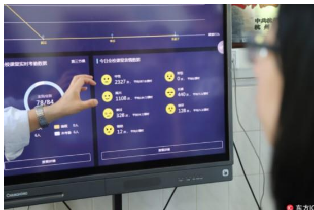
2- Расм. Тизим интерфейси.

Ҳозирги кунда соҳада замонавий АКТ воситаларнинг кириб келиши “Ёлгон Детектори”нинг аниқлик даражалари юқори бўлди. Инсоният психологиясини ўрганиш жуда мураккаб жараён ҳисобланади. Ҳозирги пайтда талабаларнинг хатти харакати ва эмоционал ҳолатини, яъни талабанинг ўқиш, ёзиш, қўл кўтариш, тик туриш, ўқитувчини тинглаш ва столга суяниш ҳамда ўқувчиларнинг юз ифодаларига қараб унинг хурсандлиги, хафа бўлганлиги, ғазабланганлиги, кўрққан ёки жиранганлигини аниқловчи дастурий восита ICBMS (Intelligent classroom behavior management system) яратилиши кўзда тутилмоқда. Олий таълим муассасасининг ўқув аудиторияларида ўрнатилган видео кузатув камераларидан фойдаланган ҳолда тизим ҳар 30 сония ичида аудиторияни кузатиб, аудиториядаги талабаларнинг психологиясини автоматик равишда ўрганиб чиқади.