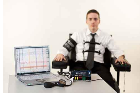
1- Расм. “Ёлгон Детектори”нинг яратилиш тарихи

Ҳозирги кунда соҳада замонавий АКТ воситаларнинг кириб келиши “Ёлгон Детектори”нинг аниқлик даражалари юқори бўлди. Инсоният психологиясини ўрганиш жуда мураккаб жараён ҳисобланади. Ҳозирги пайтда талабаларнинг хатти харакати ва эмоционал ҳолатини, яъни талабанинг ўқиш, ёзиш, қўл кўтариш, тик туриш, ўқитувчини тинглаш ва столга суяниш ҳамда ўқувчиларнинг юз ифодаларига қараб унинг хурсандлиги, хафа бўлганлиги, ғазабланганлиги, кўрққан ёки жиранганлигини аниқловчи дастурий восита ICBMS (Intelligent classroom behavior management system) яратилиши кўзда тутилмоқда. Олий таълим муассасасининг ўқув аудиторияларида ўрнатилган видео кузатув камераларидан фойдаланган ҳолда тизим ҳар 30 сония ичида аудиторияни кузатиб, аудиториядаги талабаларнинг психологиясини автоматик равишда ўрганиб чиқади.