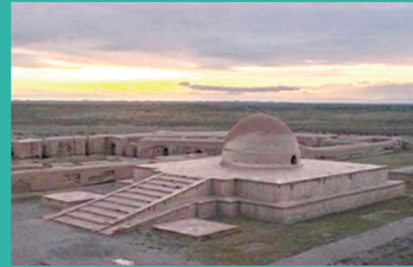
ТАРИХИЙ ХОТИРА МАДАНИЯТИ – ИЖТИМОЙ ТАРАҚҚИЁТ ОМИЛИ... CULTURE OF HISTORICAL MEMORY IS A FACTOR OF SOCIAL DEVELOPMENT КУЛЬТУРА ИСТОРИЧЕСКОЙ ПАМЯТИ – ФАКТОР ОБЩЕСТВЕННОГО РАЗВИТИЯ