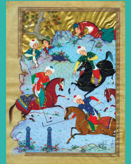
МИНИАТЮРА САЊАТИ: АНЪАНА ВА ЗАМОНАВИЙЛИК ИСКУССТВО МИНИАТЮРЫ: ТРАДИЦИИ И СОВРЕМЕННОСТЬ ART OF MINIATURE: TRADITION AND MODERNITY