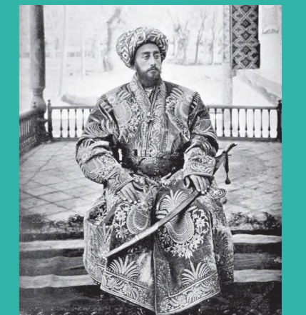
ЎРТА ОСИЁ ХОНЛИКЛАРИДА ТАҚДИРЛАШ ТИЗИМИ СИСТЕМА НАГРАД В СРЕДНЕАЗИАТСКИХ ХАНСТВАХ SYSTEM OF AWARDS IN CENTRAL ASIAN KHANATES