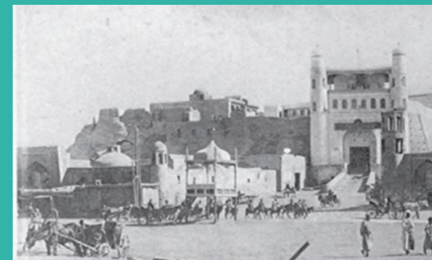
БУХОРО РЕГИСТОНИДАГИ ЁДГОРАИКАЛАР ТАРИХИ ИСТОРИЯ ПАМЯТНИКОВ РЕГИСТАНА БУХАРЫ HISTORY OF MONUMENTS OF REGISTAN OF BUKHARA