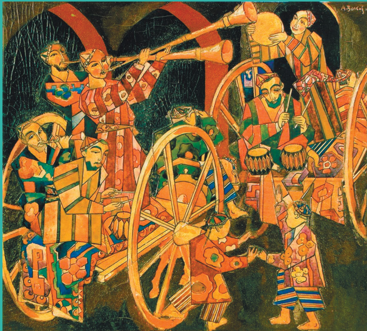
Александр Волков. “Ўзбек байрами” 1926/1927 йй. Александр Волков. “Узбекский праздник” 1926/1927 гг. Alexandr Volkov. “Uzbek holiday” 1926/1927