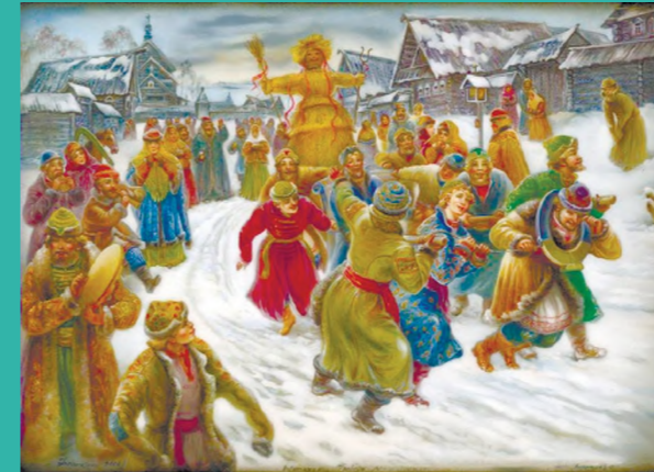
НАВРЎ ВА СЛАВЯНЛАРНИНГ БАҲОР БАЙРАМАЛARI НАВРУЗ И ВЕСЕННИЕ ПРАЗДНИКИ СЛАВЯН NAVRUZ AND SPRING HOLIDAYS OF THE SLAVES