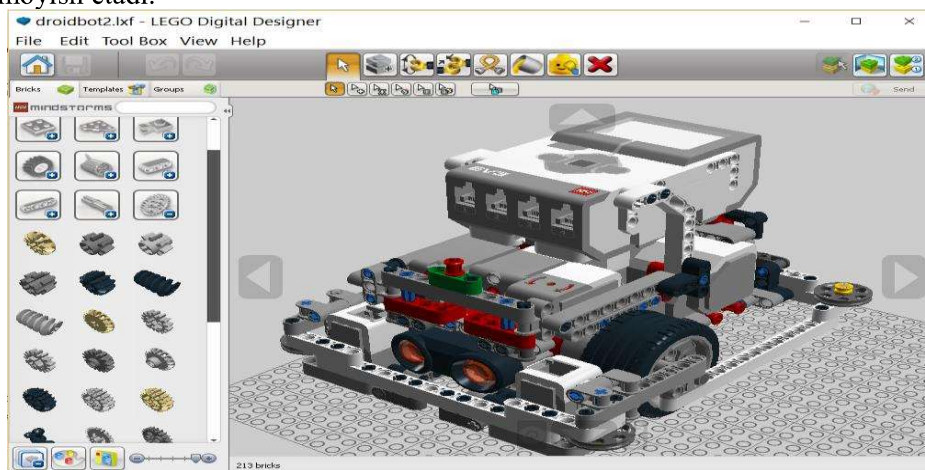
1-rasm. Dastur oynasi

LEGO® Digital Designer™ da modellashtirish juda sodda va boshqa tizimlar bilan taqqoslash oson, mahsulot assortimenti SAPR , dasturiy ta’minot LDD robotni yaratish jarayonini yoki LEGO® ning boshqa modellarini aniq aks ettiradi. Model qurilgandan so‘ng, LDD ishlatiladigan barcha qismlarni, shuningdek robot yoki modelni yaratish ketma-ketligini, ya’ni jismoniy robotni yaratish uchun ishlatilishi mumkin bo‘lgan ko‘rsatmalarni namoyish etadi.