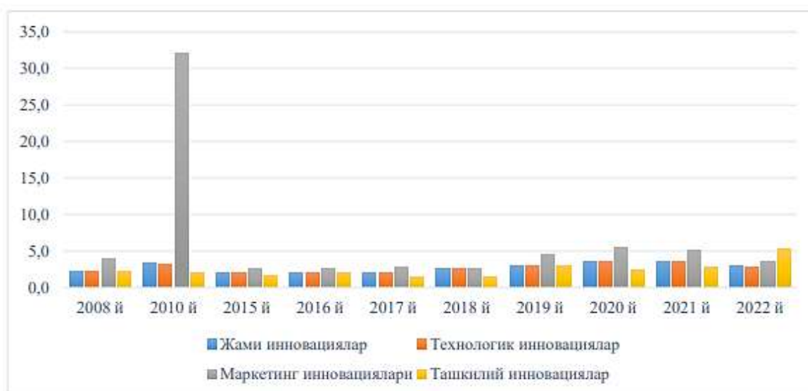
2-расм. Ўзбекистонда корхона фаолиятида инновациялардан фойдаланаётган корхоналарнинг ҳар бирига тўғри келадиган ўртача инновацион лойиҳалар сони, бирликда 8

миллий иқтисодиёт тармоқларида хўжалик юритаётган корхоналар фаолиятида маркетинг инновацияларидан фойдаланаётган корхоналар ташкилий турдаги инновациялардан фойдаланаётган корхоналар кўрсаткичларга нисбатан энг кам улушга эга эканлиги билан характерланади. Таҳлилларга кўра, 2008-2022 йилларда бу турдаги корхоналарнинг инновациялардан фойдаланаётган жами корхоналар таркибидаги улуши мос равишда 4,9 фоиздан 2,4 фоизга қисқарди. Аммо уларнинг абсолют кўрсаткичлари қарийб 2,5 мартага ортиб, корхоналар фаолиятида ташкилий инновацияларидан фойдаланаётган корхоналар сони 21 тадан 52 тага етди. Ушбу ҳолат мамлакатимиз иқтисодиётида хўжалик фаолияти юритаётган корхоналарнинг инновацион фаоллиги ортиши ҳисобига корхоналар аста секинлик билан инновацион менежмент ва маркетинг дастурларидан ўзаро мутаносибликда фойдаланиш амалиётига ўтиб бораётганлигидан далолат беради;